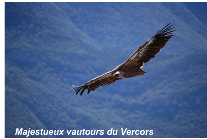
Majestueux vautours du Vercors