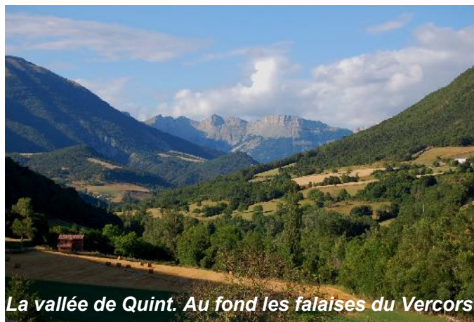
La vallée de Quint. Au fond les falaises du Vercors