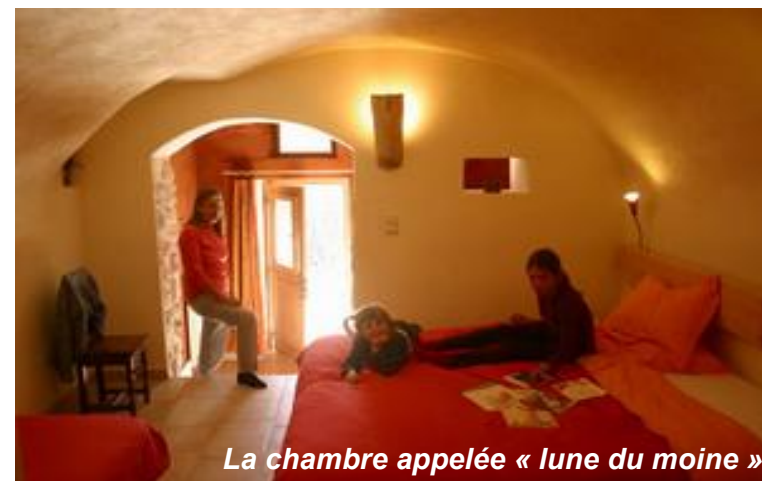
La chambre appelée « lune du moine »