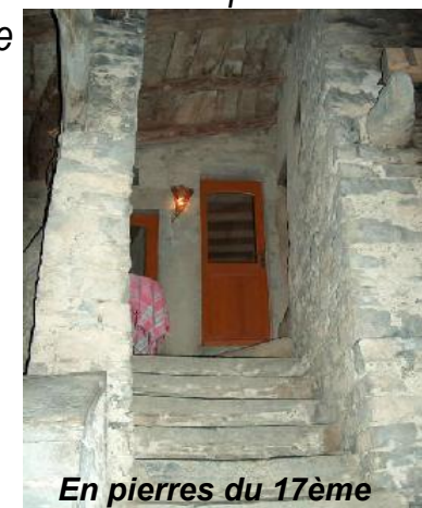
En pierres du 17ème