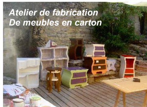
Atelier de fabrication De meubles en carton