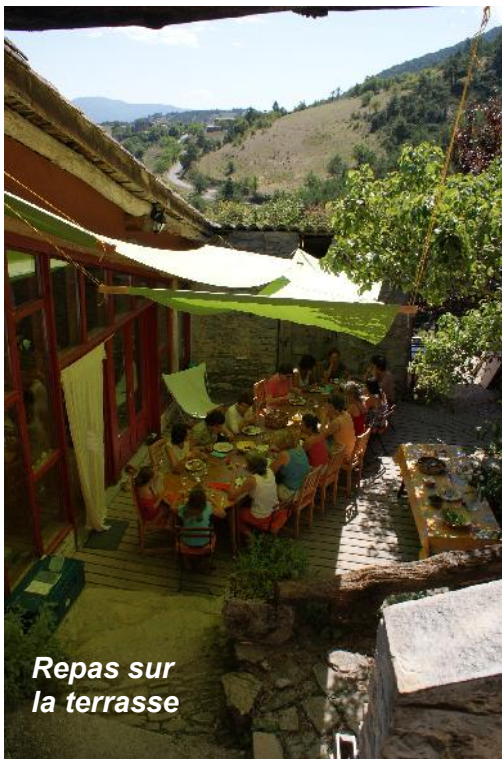
Repas sur la terrasse