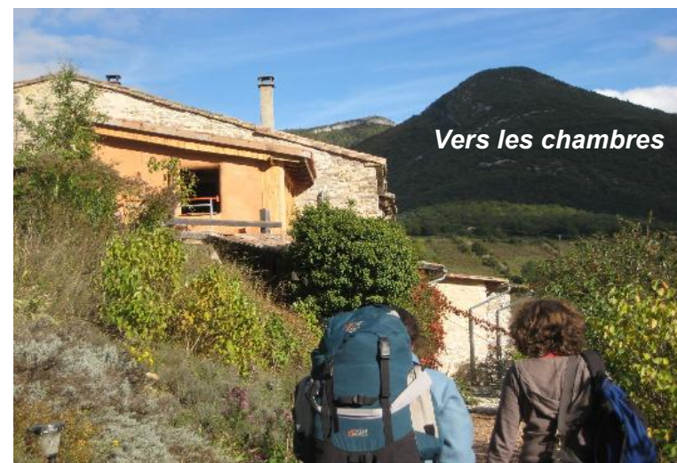
Vers les chambres